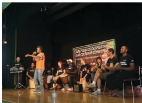
Madera de Cayuco es uno de los grupos que actuará por el cierre de los CIE.

procedencias y estilo musical. Todas ellas están disponibles en la página www.unapegatinacontraelcie.com para escucha y descarga libre, ya que cuentan con licencia de música libre Creative Commons.