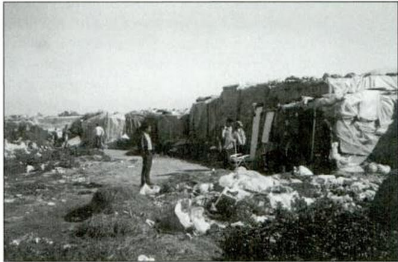
Ramón Josa i Campomator

Esta discriminación en origen ha producido en el año 2001, y continúa produciendo en la actualidad, graves conflictos laborales y sociales. Por una parte, supone impedir el derecho al trabajo a personas asentadas en el territorio español, que ven así imposibilitada su subsistencia y su proyecto de integración, y se ven abocadas a una situación de marginalidad que las hace dependientes de los servicios sociales, con el perjuicio que esto