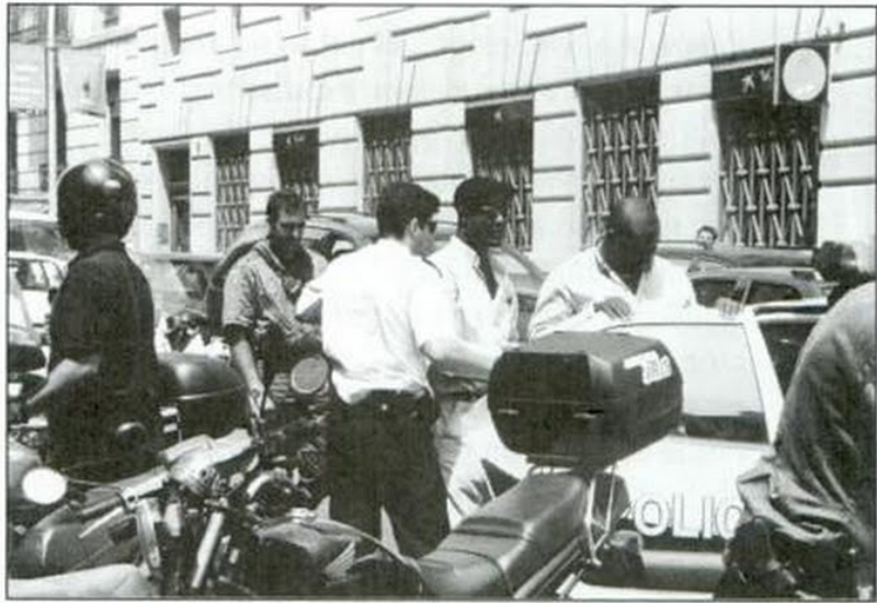
Ramón Josa i Campaamor

MADRID. Julio. Rajoy quiere expulsar a los extranjeros detenidos. Las ONG y la oposición rechazaron la iniciativa del ministro del Interior de dirigirse al Ministerio de Justicia para que «solicite o sugiera» al ministerio fiscal que pida la expulsión de los inmigrantes irregulares que cometan delitos. Rajoy hizo el anuncio tras un Consejo de Ministros y para fundamentarse, mostró una lista de indocumentados con múltiples detenciones en la provincia de Barcelona. Desde SOS Racismo se respondió que ésta no es una cuestión vinculada a la Ley de Extranjería, sino a la legislación penal. La Ley de Enjuiciamiento Civil estipula que quien cometa un delito en España debe ser juzgado aquí.